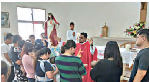
▲嬰兒及父母親接受神父的特別降福

彌撒後眾人移往部落聚會的廣場，那裡已擺置好為盛會準備的桌椅、豐盛的各式食物與飲料、祝賀的實用禮物用品、共融分享喜悅的肉品等，慶祝