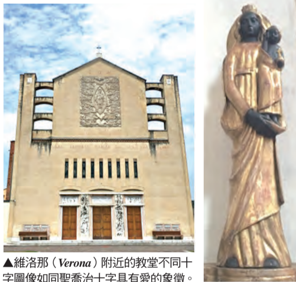
▲維洛那 (Verona) 附近的教堂不同十字圖像如同聖喬治十字具有愛的象徵。

一趟旅程相遇「愛之都」，充滿驚豔！欣賞這北義的歷史悠久古城，記憶這中世紀古城，她留下眾多的古羅馬遺跡，包括神似羅馬版本的圓形競技場。維洛那最雄偉的建築是這座圓形競技場，這是一座羅馬式圓形露天劇場，競