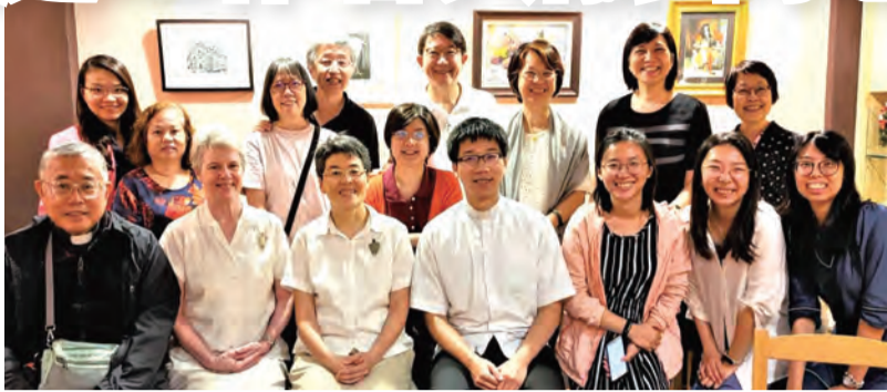
▲台北總教區家庭服務事工夥伴們喜相逢，為建立信仰家庭而同心努力。

教理推廣中心成立之初的宗旨在協助堂區主日學的發展及教理老師的培育。以推廣教理為核心；而教理講授的核心是——基督！早期承辦