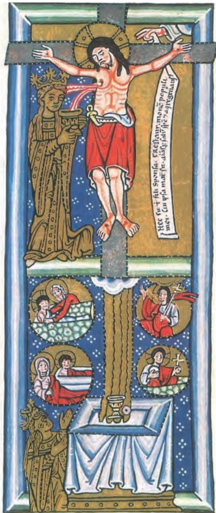
▲基督親自建立聖體聖事，除免世罪的天主羔羊，成為一次而永久的祭獻。