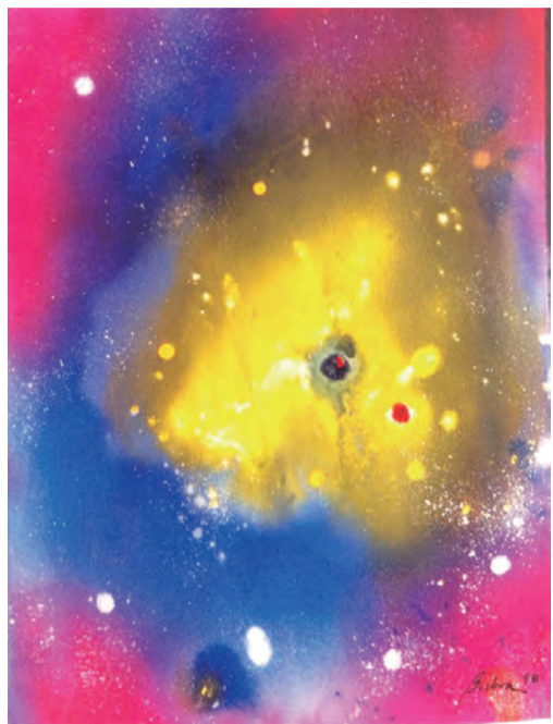
▲耶穌聖心，宇宙之心！