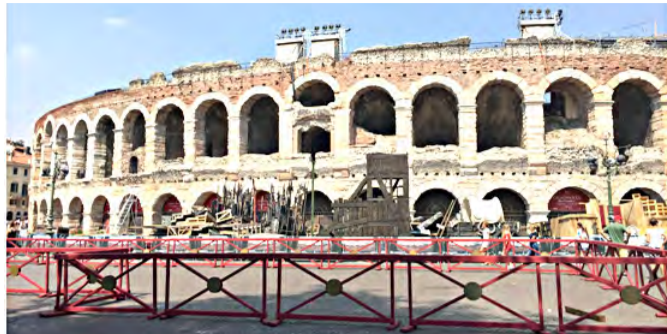
◀主領廣場內的中世紀詩人但丁雕像▲維洛那 (Verona) 圓形競技場。