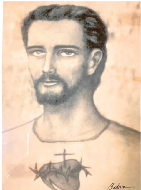
▲鮑博在菲律賓碧瑤神學院畫的〈耶穌聖心〉素描

過去的一切就讓它過去，面前新的一年好好珍惜，未完成的心願，為愛主繼續完成。在日常，活出信仰的生活，多關心、陪伴親人，每天