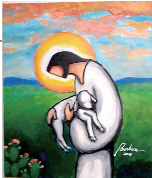
▲每人在鮑博的畫中，依照自己的心境，會看到耶穌的面容，這就是為什麼鮑博的耶穌聖像畫，較少畫出耶穌的五官。

並藉仁慈的聖母轉禱，讓內心重新出發。60歲是一個人生旅程的開始，期許從今以後，除了細讀《聖經》、祈禱之外，更要與家人邁向聖家之路。因先父母之信仰傳留於我，晚輩或孫子之信仰更為堅固，並使信、望、愛三德落實於生活中。