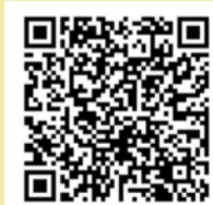
找到通往基督的橋 QR Code

感謝生命倫理中心指點迷津，提供該書內容分析，掃描下方QR Code即可看到全文。