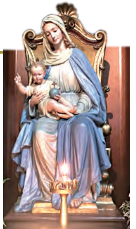
▲慈悲聖母抱著聖子像。